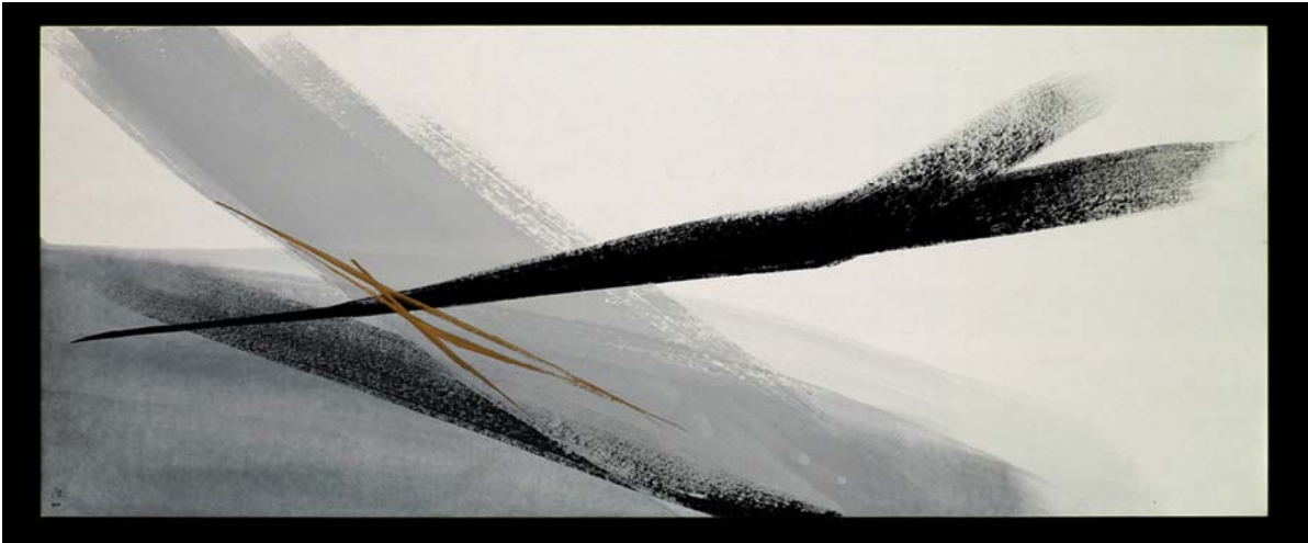
2 「In Days to Come ゆくへ」 墨、金泥、胡粉、和紙 2008年 70.0x180.0cm