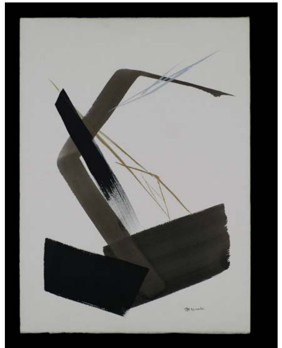
5 「Memory 回想」 墨、金泥、銀泥、紙 1996年 76.5x55.5cm