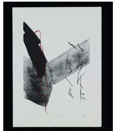
6 「Katachi かたち」 リトグラフ、手彩 1980年 36.0x27.0cm ed. 17/35