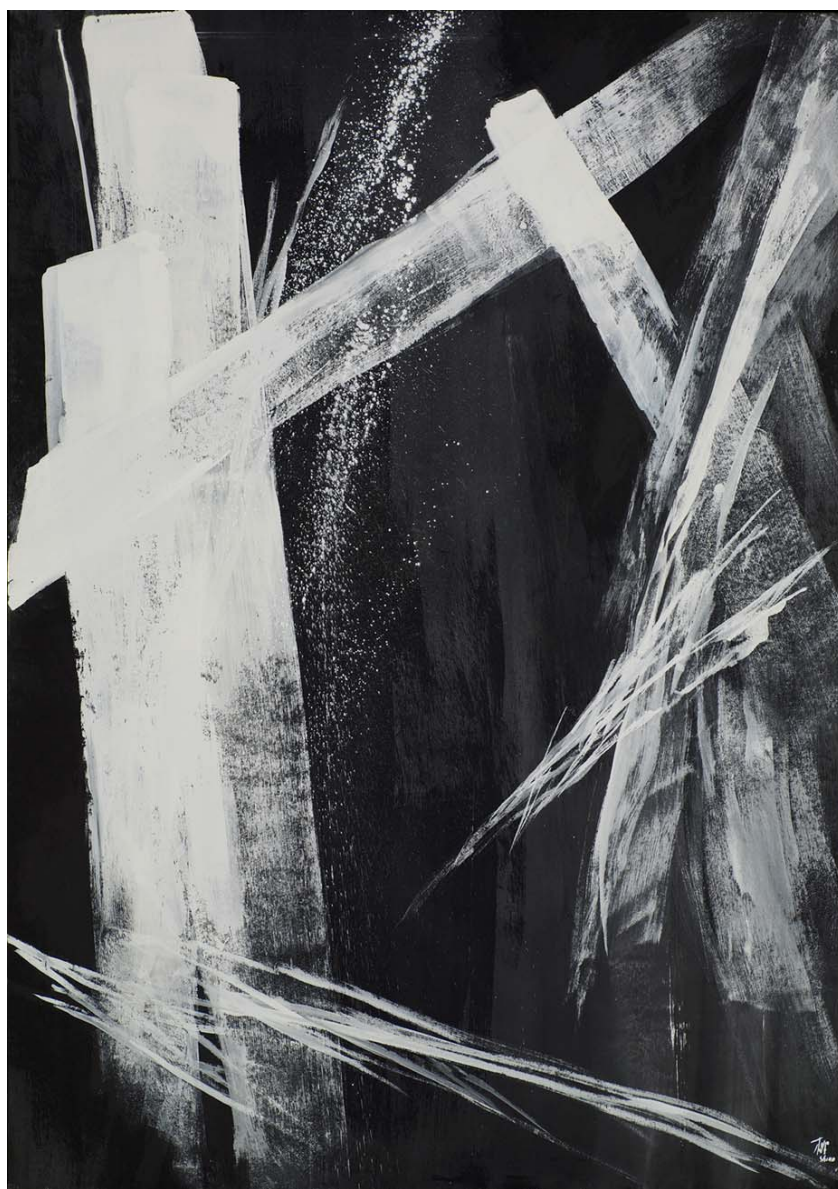
1 Discovery ひらく 墨、胡粉、和紙 1962年 215.0x149.0cm

Toko Shinoda - A Lifetime of Accomplishment